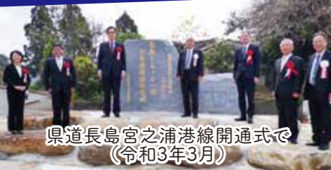
県道長島宮之浦港線開通式で(令和3年3月)