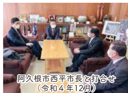
阿久根市西平市長と打合せ(令和4年12月)

令和2年7月の獅子島を中心とする豪雨災害に、小里泰弘は現地視察を踏まえて「激甚災害指定」や農地、河川、道路の復旧に奔走。アオサ被害も水産庁の事業で支援。