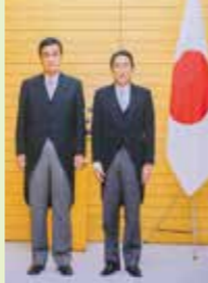
内閣総理大臣補佐官に就任

信条 花に水、人に心 趣味 釣り、読書、剣道 著書 「農業・農村所得倍増戦略-TPPを超えて」「災害と闘う」 好きな食べ物 たまご、コロッケ 得意な言語 かごしま弁 尊敬する人物 西郷隆盛