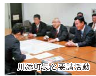
川添町長と要請活動