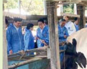
酪農現場を総理と視察(栃木)