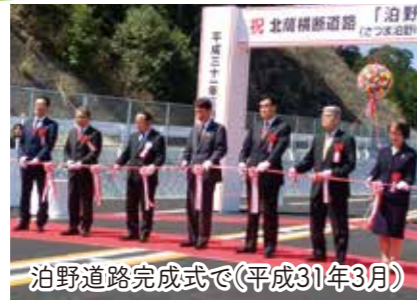
泊野道路完成式で(平成31年3月)