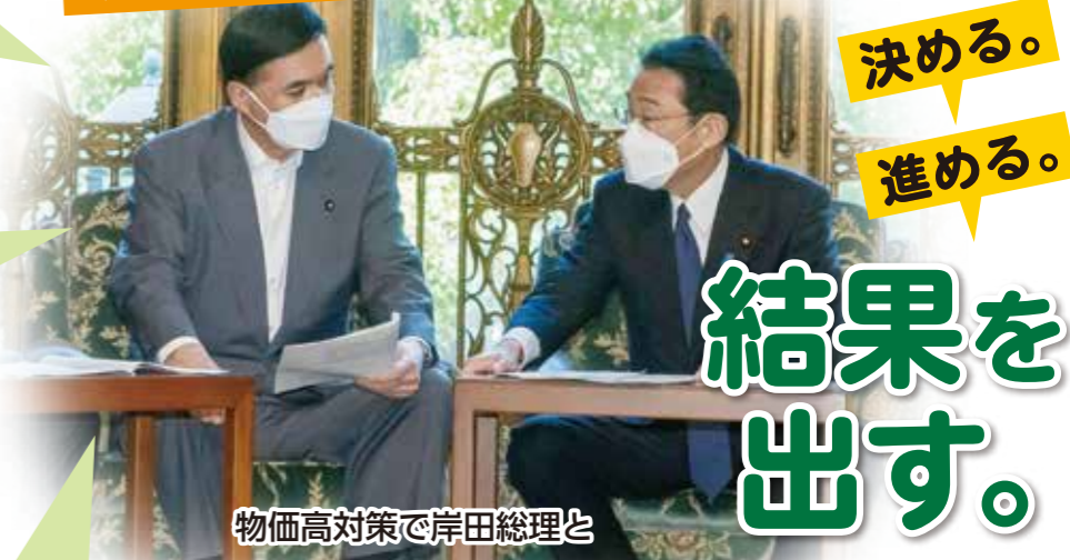
物価高対策で岸田総理と