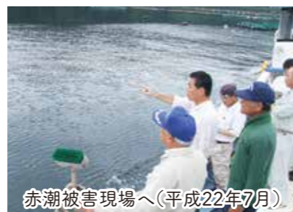
赤潮被害現場へ(平成22年7月)

地域の声にきめ細かに対応。阿久根市西目・大川・大丸・折口をはじめ、補修11箇所、除草・伐採等9箇所、ガードレール設置3箇所など。