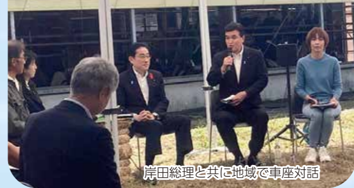
岸田総理と共に地域で車座対話