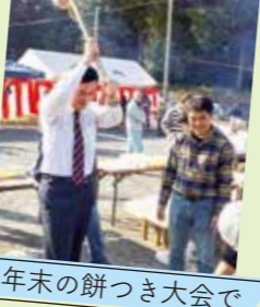
年末の餅つき大会で