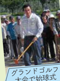
グランドゴルフ大会で始球式