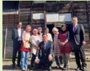
古民家食堂の皆さんと(新潟)