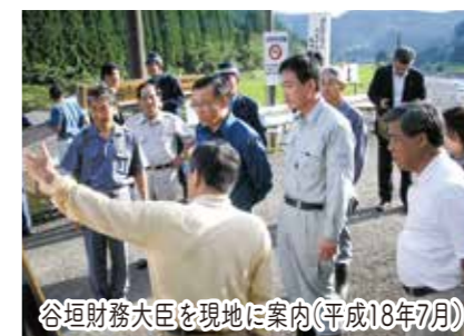
谷垣財務大臣を現地に案内(平成18年7月)

令和3年からの基腐病および令和5年冬の雪害に際し、小里泰弘は、現地視察を踏まえて農家経営の継続に向けて、肥料・消毒薬剤・防除薬剤・輪作支援などを推進。