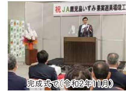
完成式で(令和2年11月)

肥薩おれんじ鉄道を観光や地域の足として守るべく支援。法改正を進め、公共事業で駅舎改築、新車両導入、レール補修などが可能に。(令和5年度～)