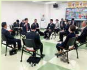
みかん農家と車座対話(静岡)