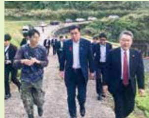
地域おこし協力隊を視察(新潟)