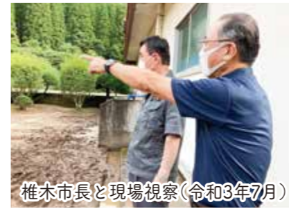
椎木市長と現場視察(令和3年7月)

薄井地区：浮桟橋新設・防波提機能診断、葛輪地区：防波堤新設・臨港道路拡幅、茅屋地区：防波堤新設、弊串地区：道路かさ上げ・物揚場耐震化等