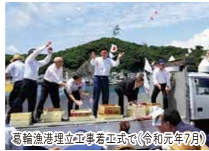
葛輪漁港埋立工事着工式で(令和元年7月)

出水市の武家屋敷を宿泊施設に改修、旅館、ホテル、レストラン、カフェの改修など20箇所の施設の観光資源としての魅力化を観光庁の事業で支援。(令和4年度～)