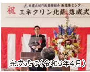
完成式で(令和3年4月)

養殖ブリの輸出を促進するべく薄井地区に近代型の加工施設整備を推進。令和7年度着工へ