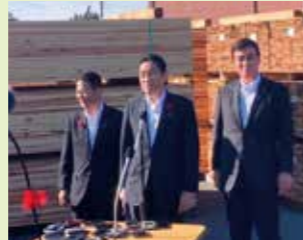
製材所で記者会見(茨城)