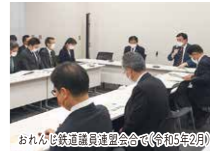
おれんじ鉄道議員連盟会合で(令和5年2月)

出水市大川内小学校の令和3年7月豪雨による米ノ津川氾らん被害に対応して、堤防かさ上げ、擁壁工事により児童の安全を確保。(令和5年3月完了)