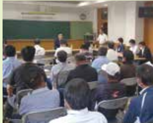
地域の皆さんと意見交換(高知)