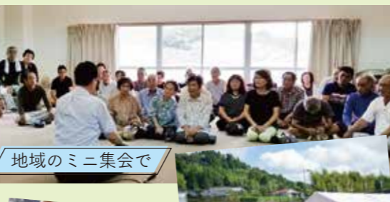
地域のミニ集会で